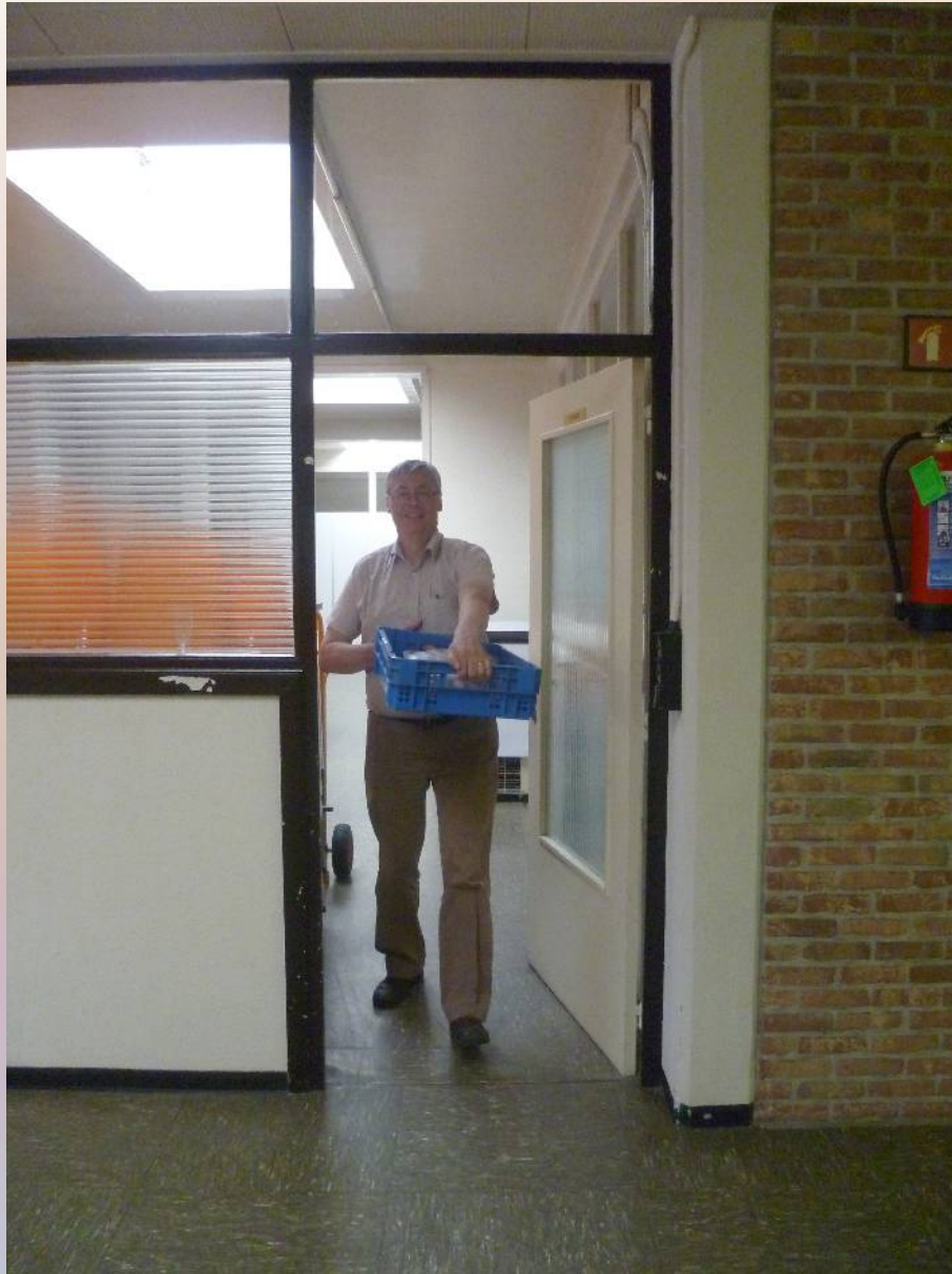
File an den toog