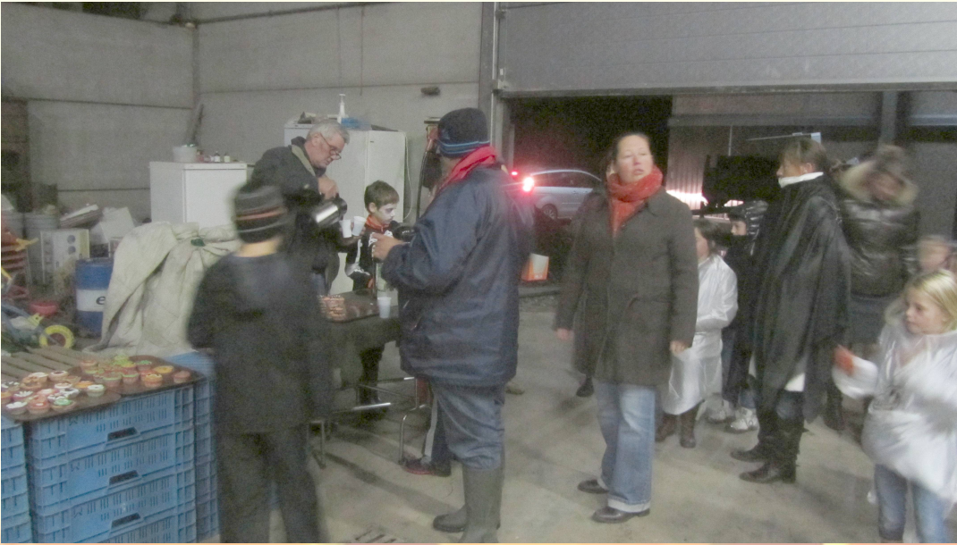
Koffie met cupcake