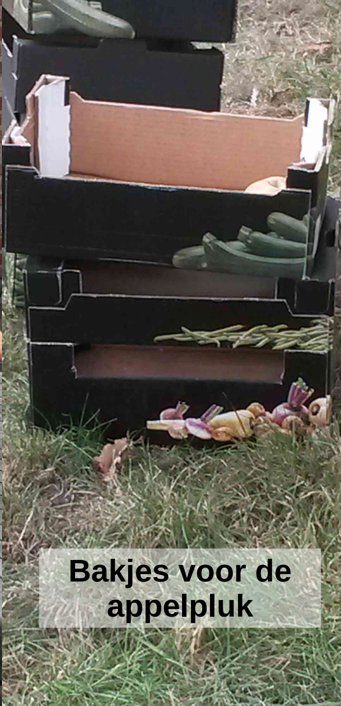
Bakjes voor de appelpluk