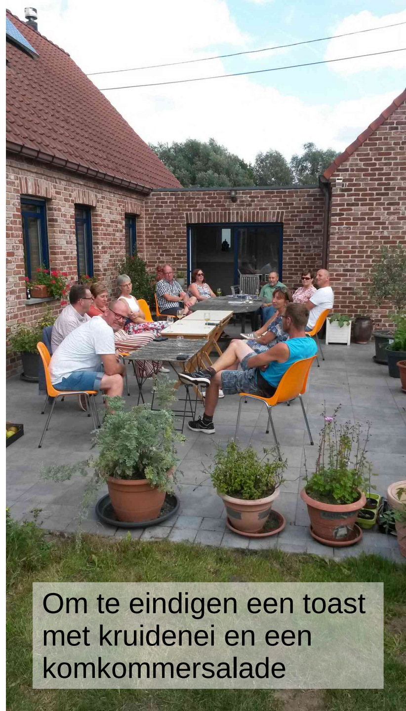
Om te eindigen een toast met kruidenei en een komkommersalade