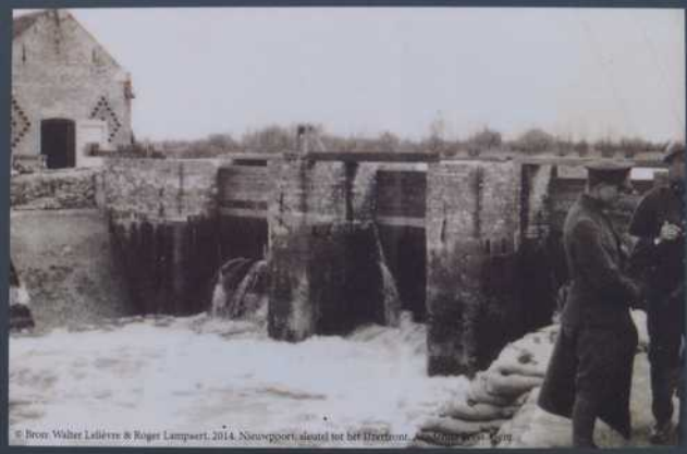
De balkenstuw op de Noordvaart-Grote Beverdijkvaart tijdens de Eerste Wereldoorlog. De genie van het Belgisch leger had bij de onderwaterzettingen de taak van het polderbestuur volledig overgenomen.