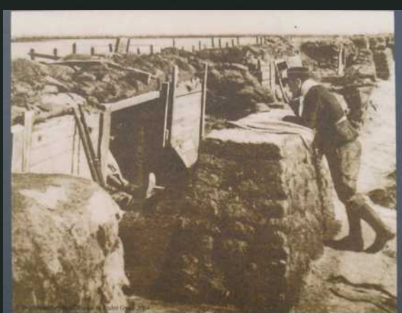
Eerste Wereldoorlog: het Belgisch leger bouwt de spoorlijn Nieuwpoort-Diksmuide om tot hun hoofdweerstandslinie. Op de achtergrond de onderwaterzetting tussen deze spoorbarm en de IJzer.