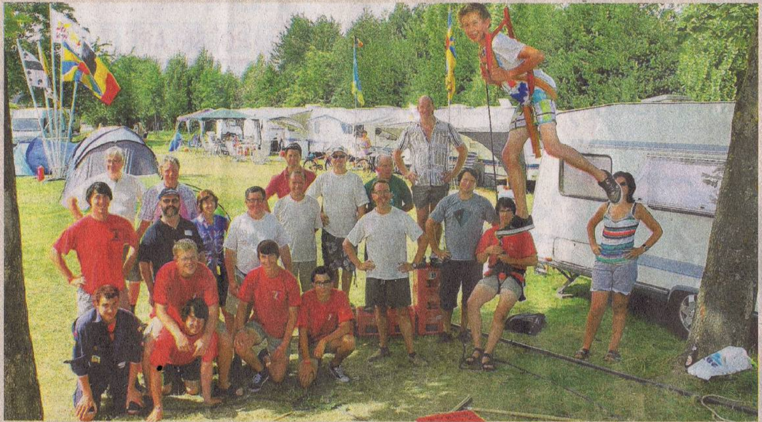
Heel wat kampeers genoten van de activiteiten op de gelegenhedscamping.

Zij mochten drie dagen lang hun tenten of caravans opstellen op het ruime grasplein en er genieten van tal van sociale activiteiten. «Want dat blijft immers de hoofdreden om ons evenement te organiseren», zegt coördinator Jan Werbrouck. «Heel wat buurtbewoners komen jaarlijks naar hier afgezakt om nog eens bij te praten en er met hun kroost te genieten van de lokale gastvrijheid. Eten gebeurde telkens in een gezamenlijke openlucht tent, maar verder waren er ook gidswandelingen, fietstochten en een kleinschalige Place du Tertre met workshops voor